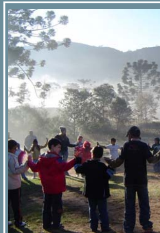
Danzando con jóvenes en Brasil

El Cambio Llegando en la Política de la cuota de la Cofradía de Líderes